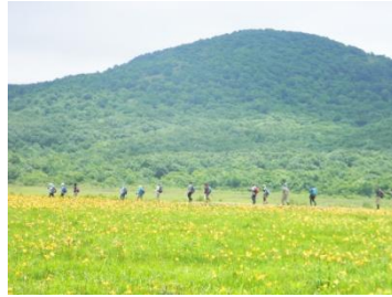
ニッコウキスゲが満開でした