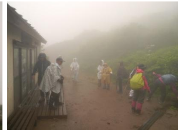
標高1800m 悪天候により景色が見えませんが…