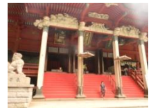
↑羽黒山 下しらべした時の写真です