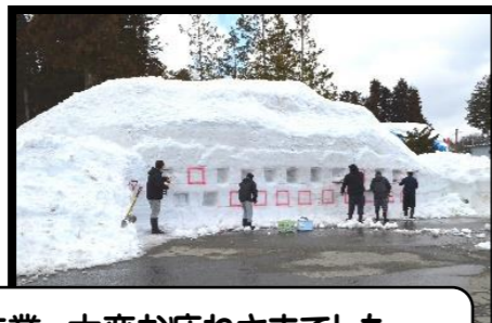
体育館、外と別れての作業、大変お疲れさまでした。おかげさまでスムーズに進めることができました。