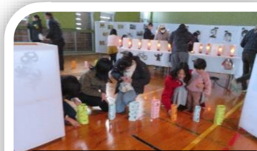
みんなで灯りを灯しましょう～

R5年3月号 白樺地区公民館(併) 白樺地区まちづくり センター 電話：72-2242 FAX：72-3551 E-mail： tubakiko@e.jan.ne.