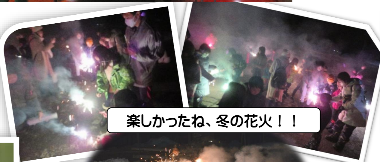
楽しかったね、冬の花火！！