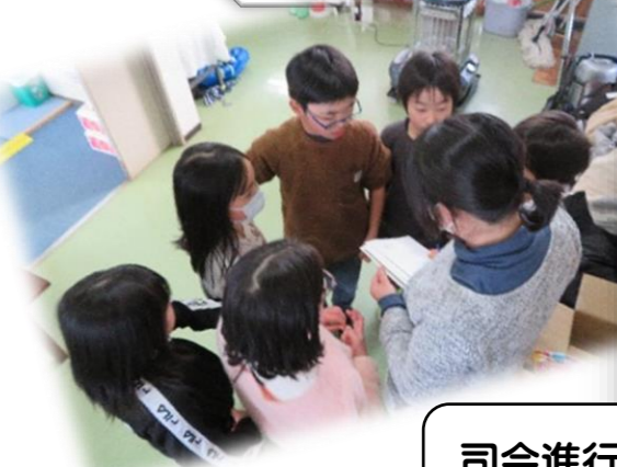
司会進行、とても上手でした。ありがとう！