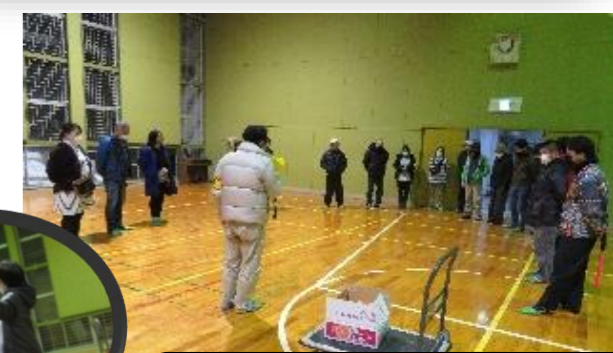
最後の後片付けまで、 本当にありがとうございました！