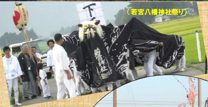
(若宮八幡神社祭り)