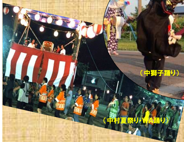
(中村夏祭り・WA踊り)