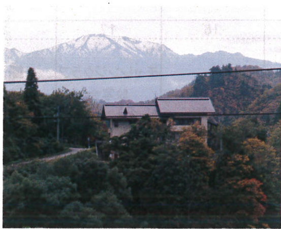
飯豊山の頭も白くなりました