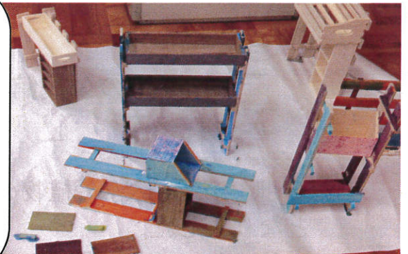
すのこでDIY!!文化祭に出します

チャレンジクラブ 秋の遠足 残念ながら...雨 公民館でお菓子を作っ たり 中津川のかるたとりを しました