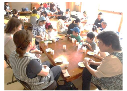
難しかったけどたのしかった~!