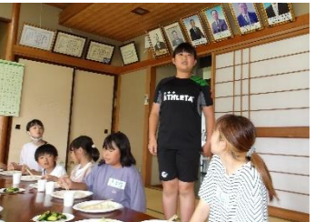
冷やし中華風そうめん昼食会 & 交流会。皆さんからうれしい感想もいただきました。おつかれさまでした!