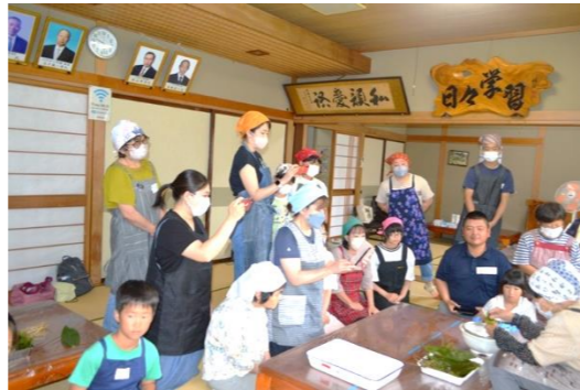
出ました! スマホで動画メモ。