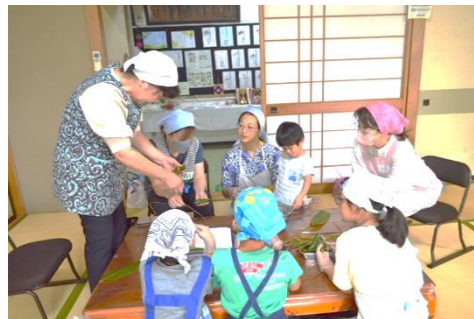
巻き方、実は何通りかあるんです。指導者のみなさんの手元をよ〜く見て、覚えようとみなさん真剣です。