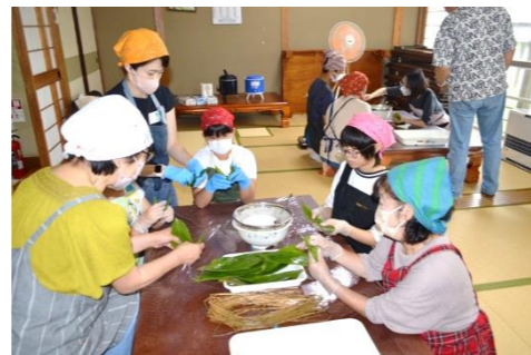
難しかったけどたのしかった~!