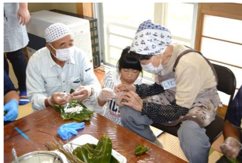
左利きの方に必殺技を伝授。