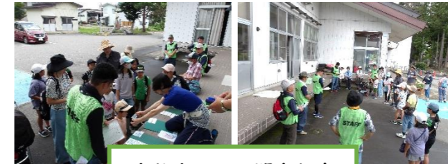
名札をつけて開会行事