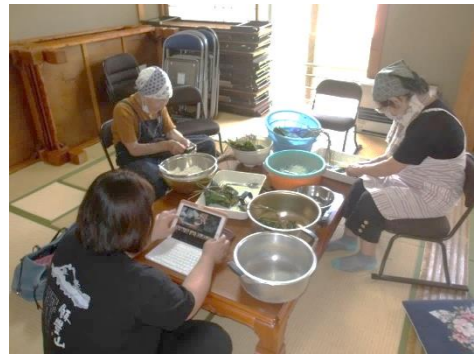
二日前、試食用笹巻き作り。