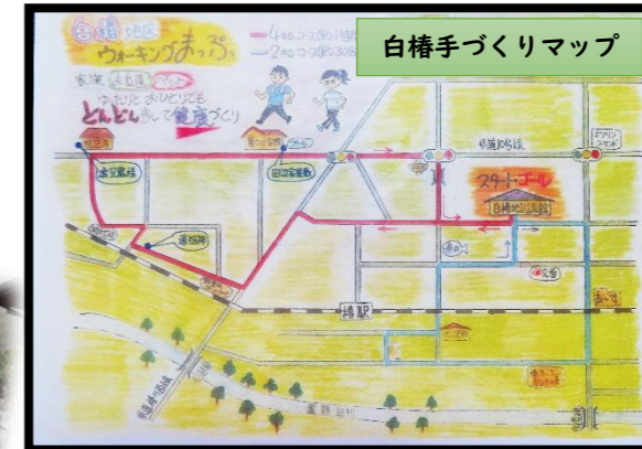
白樺手づくりマップ