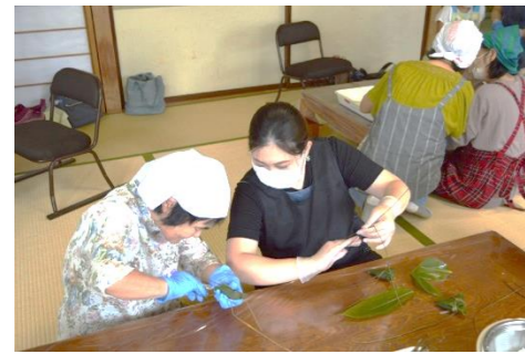
出来るようになった人は指導者に。