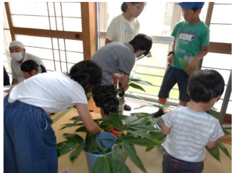
即席笹やぶで笹巻き体験。