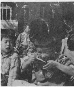
健康づくりは幼児の時から？