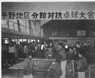
平野地区分館対抗卓球大会

第3回 地区分館対抗卓球大会要項決る 過日の分館長、主事会に於いて卓球大会要項が決定されましたので、お知らせします。 1. 期日 11月18日回 AM 8時 2. 場所 平小体育館 3. 試合方法 個人戦一分館より三名以内とし、女子一名含む、11本3セットとする。 団体戦一分館ごと一チームが原則 チームの編成は、小中学生から親子、壮年の区分あり、のオーダ編成。 （尚、くわしくは、各分館長さんにお聞き下さい。）