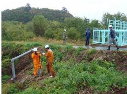
桜田橋水管橋排水状況