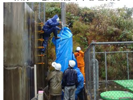
減勢工電気設備冬季管理状況