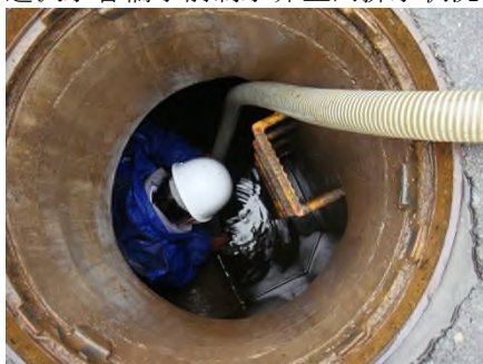
遅沢水管橋手前制水弁室内排水状況