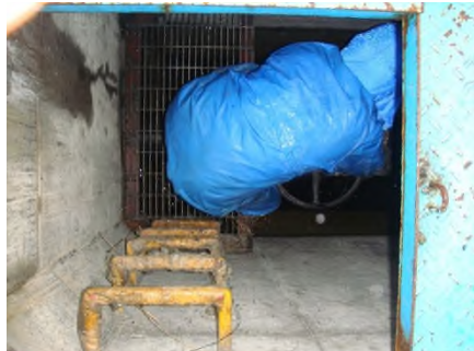
5号制水弁全閉操作状況