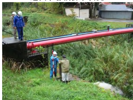
遅沢水管橋排水状況