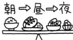
食事は決まった時間に食べた。