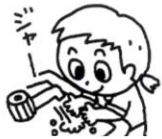
食事の前には必ず手をきれいに洗った。

1年間を振り返り、食事の場面でどのようなことができるようになったかお子さんと一緒に見て、できていたらほめて下さいね！