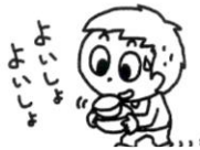
食事の準備や後片付けをよく手伝った。