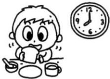
朝食を食べて、登園した。