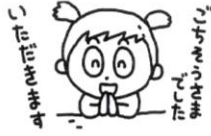
感謝の気持ちを込めてあいさつをした。