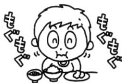
よくかんでゆっくり食べた。