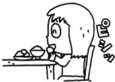
よい姿勢で食べた。