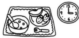
おやつは決まった時間に決まった量だけ食べた。