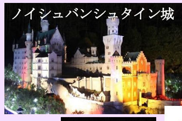
ノイシュバンシュタイン城