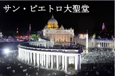
サン・ピエトロ大聖堂

~世界各国47の世界遺産を含む、世界の有名な建築物102点が25分の1の縮尺で精巧に再現~