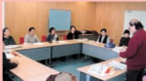
毎月第4土曜日に開く例会

余目五行歌会では、「一緒に五行歌を楽しむ歌友はいつでも大歓迎です」とのこと。 「山形市周辺の愛好者の方も集まって、歌会をつくって、歌を……」とも呼びかけています。 皆さんも、ふつと心に浮かんだ思いを「五行歌」にして、自由に表現してみませんか。