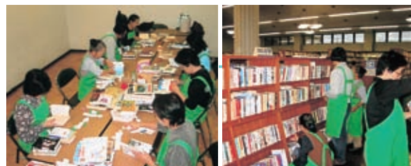
本の配架や修理を行う図書整理グループ

若葉の輝きを思わせる『小荷駄のみどりから』。こんな素敵な名前前で活動しているのは、山形市立図書館ボランティアの皆さんです。 「小荷駄」は、図書館のある町の名前で、「4年前に市報で募集の呼びかけがあった時、