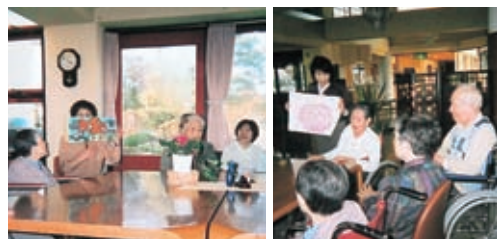
施設を訪問する読み聞かせ等グループ

声に出して読むと、目で読むのはまた違うものが見えてくる：と本の魅力を再発見しています。 読み聞かせ等グループは、子供たちや高齢者に、絵本や民話を読んだり、物語の素語りをしていく方たち。 「お年寄りとは『読み合い』。施設に所属している方と接すると、逆にパワーをもらって来るとですよ。」本を通して、あたたかな交流が生まれています。