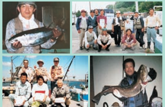
「釣り依存症かも…」と笑うほどの釣り好きばかり

釣り歴の長い会員が多く、16.5キロもの大物の寒鰯を釣り上げたり、一日で15キロ級のブリを4本も釣ったりと、プロ級の腕前の方も。