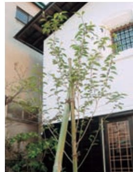
開店記念に植えた桜の木

前から、生の演奏を聴いたり、お友だちとゆつくりお茶を飲みながらお話ししたり、そんな場所があればいいな……と 思っていました。 それで教師を退職した後、妹夫婦と姪と一緒に、喫茶とギャラリーをかねた『瑳蔵』を開いたんです。100年以上も前に建てられたお蔵を、そのまま生かしてね。 『瑳蔵』の名前は、私の大好きな桜にちなんで名付けました。この「瑳」には「白い歯を見せてにっこり笑う」という意味があるんですよ。 庭には開店の記念に植えた一本の桜が。この桜の成長に、若い人たちの未来を思う心を重ねているようです。