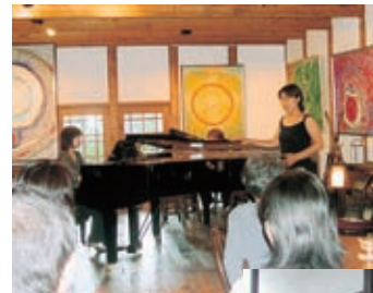
月2回開いている カフェ・コンサート