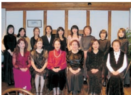
「シューベルトの夕べ」と題して開いた 「詩音会」の第1回目の演奏会

「音楽」をパートナーに、素 敵な人生のメロディを奏で る川部さん。桜の枝にそつ と触れる春風のような、柔 らかな笑顔がこぼれました。