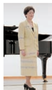
縮緬の付け下げの縞模様をスーツのアクセントに