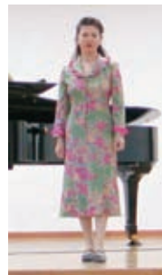
小紋を使いピンクの八掛をフリルにしたワンピース