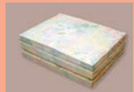
最高級の肌ざわり 絹掛ふとん 健康ふとん 整体マトラ