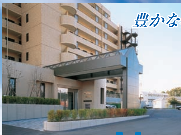
▲ダイアバレスヒルズ山手森 (キャンビー・ トップライト工事)

金属工事から金属製建具施工、 トップライト工事まで、 高い施工技術と豊富なノウハウで、 多様なニーズに対応。 豊かな都市空間を創造します。