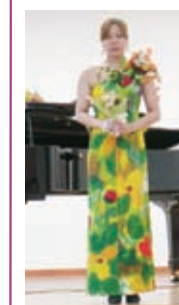
お母さんの着物を娘さんのお色直し用のドレスに