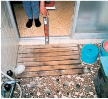
改修前、出入口に約10センチの段差が