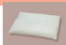
首筋を自然に支える 頸椎安定型 ソフトパイプクールピロー