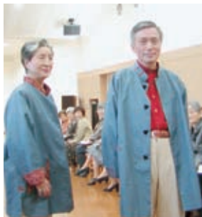
男性の着物を使い小紋の布で袖口などにアクセントをつけたベアのコート