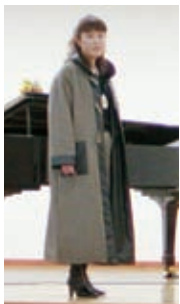
長井紬としザーを組み合わせたリバーシブルのコート