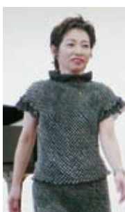
シルクの豆絞りで仕立てた個性的なツーピース