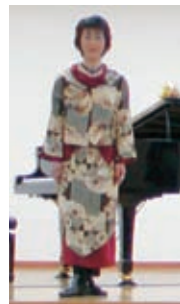
男性の肌じゅばんと女性の八掛で作ったツーピース