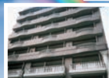
▲山一地所一番町マンション (ベランダ・フェンス工事)