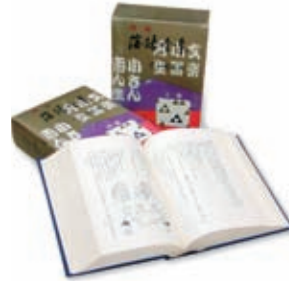
50年ほど前に懐かしくて買った という落語全集の復刻版

落語は滑稽噺でも人情噺でも、 時代を超えた人間の営みとしての笑いや 人情があるのが魅力なんですね。