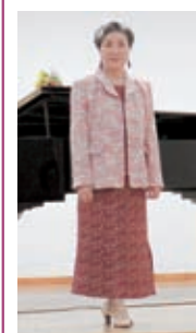
小紋を使ったツーピースと羽織で作ったジャケット