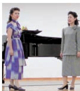
それぞれ明治時代の銘仙(左)と縮緬(右)で作ったツーピース