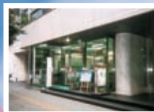
▲第一オフィスビル (ステンレス建具工事)

金属工事から金属製建具施工、 トップライト工事まで、 高い施工技術と豊富なノウハウで、 多様なニーズに対応。 豊かな都市空間を創造します。