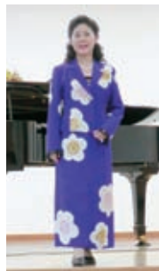
大正時代の着物にフランス製のレースを組み合わせて