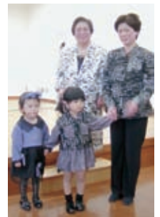
小紋と羽織をおばあちゃん、娘さん、ひ孫さんの3世代の洋服に