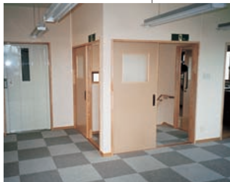
汚れた部分だけ取り替えられるカットカーペット

また、右の写真のように、カットしたカーペットを敷くと、汚れた部分だけ取り替えられるので経済的です。床材は、手入れのしやすさも考えて選びましょう。