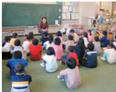
素朴であたかい昔話を語る方も

いまでは毎週木曜日に、寒河江小と寒河江中部小に交互に出向いて、全学年全クラスで読み語りを行っています。