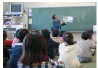
楽しい話に大きな笑い声が

絵本の楽しさを知った子供たち。その心には、本好きの種が蒔かれ、思いやりと優しさの芽が育っていることでしょう。