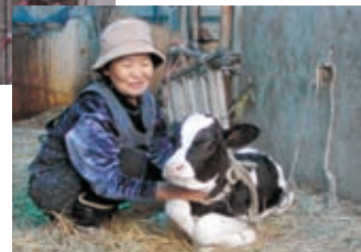
前の日に生まれたばかりの子牛