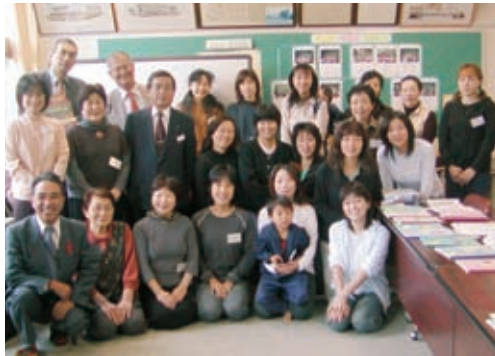
「絵本を通して子供の心を育てたい」と皆さん

絵本を 読むあた たかい声 が響いて 物語の世 界が広が る教室。 瞳を輝 かせ、無 心に聴き 入る子供 たち。