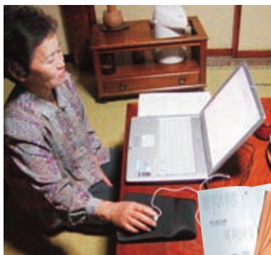
パソコンにも挑戦

手塩にかけて育てた作物が 「おいしいね」と言われるの が喜び。自然に逆らわずに、 安全で皆に喜ばれる作物を 作りたい…と燃えています。