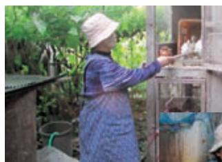
鶏や鳥骨鶏、チャポ の飼育も