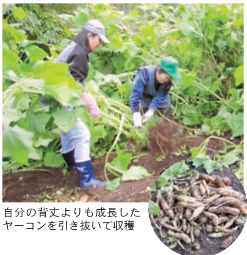
自分の背丈よりも成長した ヤーコンを引き抜いて収穫

茎の下の小さい塊から芽が 出るので、それを冬場凍らせ ないように保存しておいて、 つぎの年に芽出ししました。 うちは牛舎の2階に藁を積ん でいて、そこで糠に入れて保 存したから冬が越せたの。 そうして苗をとることがで きたのは、私一人でした。そ