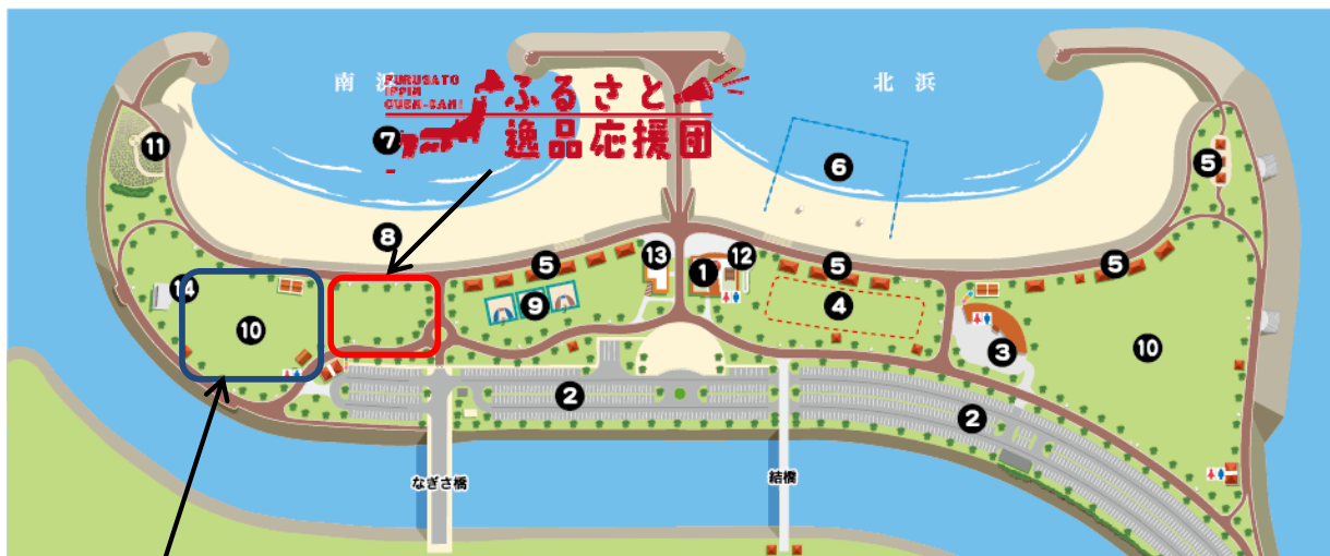
おやじラブロックフェスティバル会場