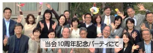
当会10周年記念パーティにて

私達は社会貢献活動と、より良いカウンセリング提供のためのスキルアップを目的に、南東北を中心に活動するキャリアカウンセラー有資格者の団体です。臨床心理士・官公庁や大学のカウンセラー・経営者・人にまつわるキャリアのメンバーで構成されています。有料事業での収益を活用し、今回のようなボランティア事業も行っています。