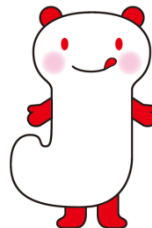
<地場もん国民大賞 キャラクター「ジバモン」>