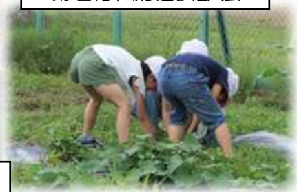
第1回雑草取り選手権大会