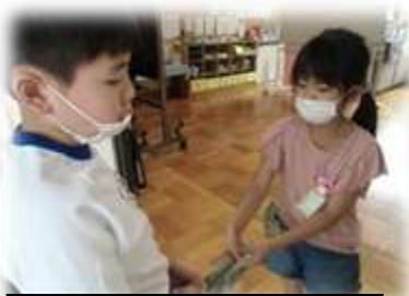
きゅうりのプレゼントです