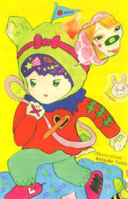
Illustration: Keisuke Saito