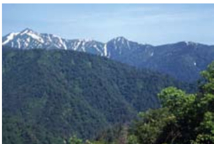
愛染峠から望む朝日連峰

7 月上旬、愛染峠から朝日連峰を見てきました。朝日町には友人も多くよく来ていましたが、こんなに素晴らしい景色が車で行けるところにあるんですね。