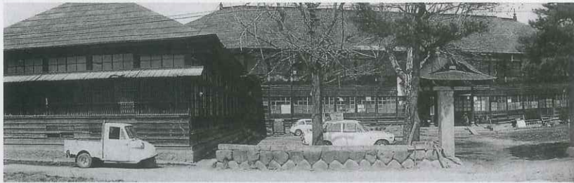
1885(明治18)年に創設された山辺学校(現在の中央公民館敷地)

町内には昔の写真が数多く残っています。その代表的な写真をもとに、現代の地図と実際の街の様子を比較して眺めてみましょう。