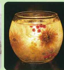
フラワーキャンドル(大)