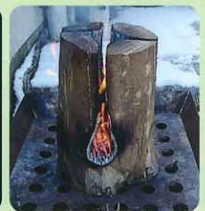
スウェーデントーチ