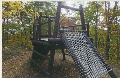
森の砦が新しくなりました。